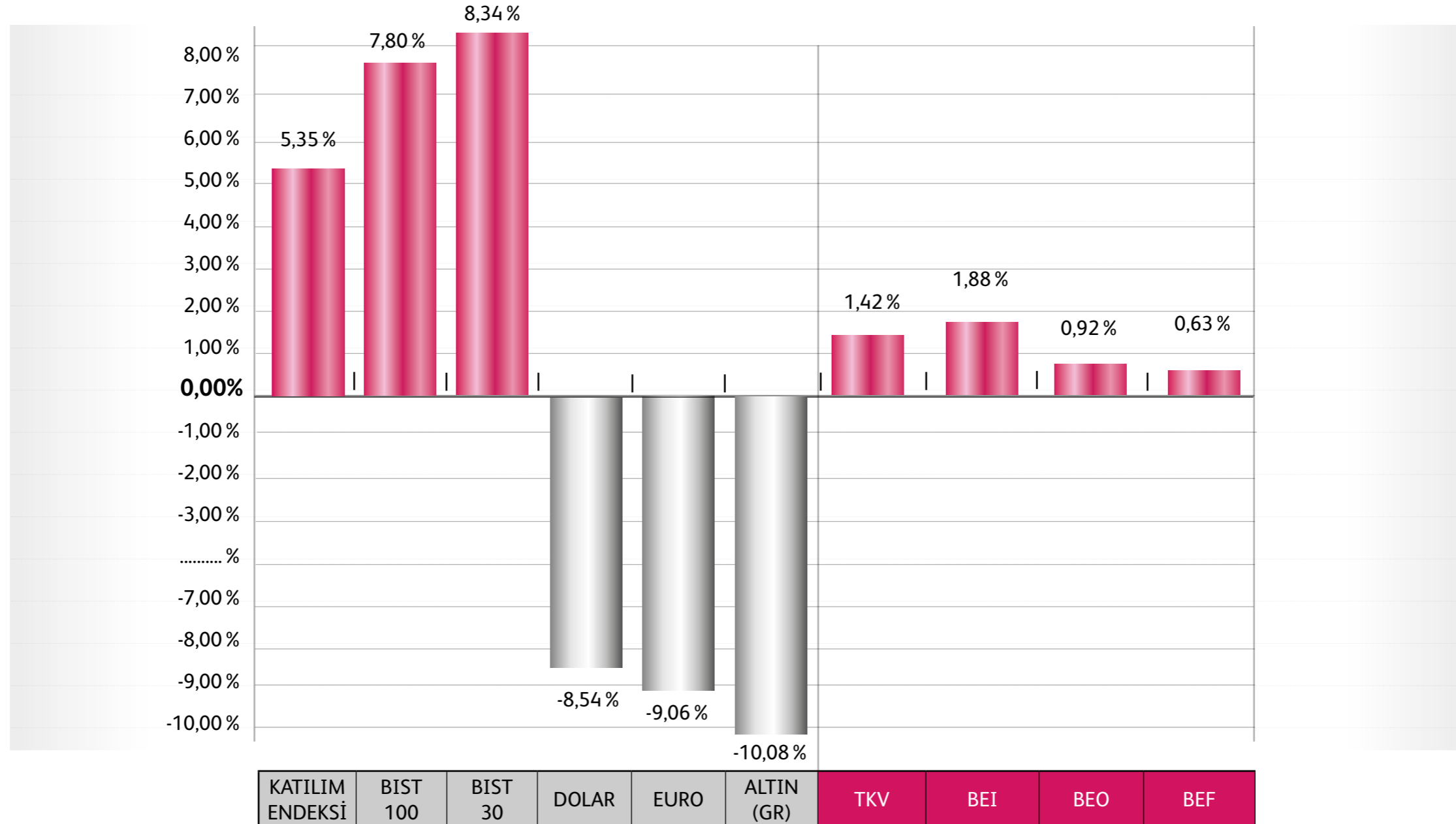
YÜZDESEL GETİRİ GRAFİKLERİ (30 Eylül) Bereket Emeklilik ve Hayat A.Ş. Emeklilik Yatırım Fonları